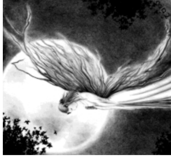
Dibujo de Irene Ripoll Navarro