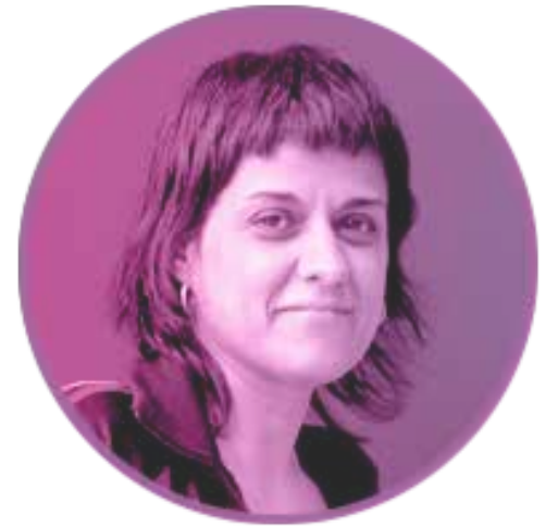
ANNA GABRIEL Militant d'Endavant (OSAN) i ex-diputada de la CUP-CC

Haurem passat un altre 25 de novembre amb actes de denúncia, accions i declaracions solemnes. Segurament, tot el que s'hagi fet haurà servit per crear una mica més de consciència; haurem actualitzat les xifres de dones assassinades, agredides o violades, i haurem dedicat una part del nostre temps a reflexionar sobre com pot ser que hàgim de cridar que no en volem ni una més. Haurem passat, en definitiva, un altre 25-N. I haurem sumat un dia més de presó, un dia més de maltractaments, un dia més de gana o un dia més de por. Sia als Països Catalans o a Ginebra, hi ha dies que passen per a totes igual.