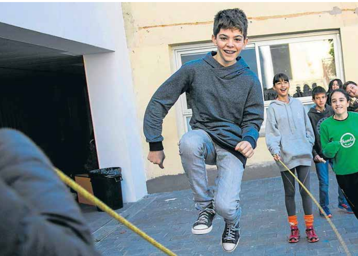
Un grup de nens i nenes de l'escola Tecnos de Terrassa juguen a l'hora del pati, en una foto d'arxiu.

D'altra banda, diverses escoles estan treballant també per canviar les dinàmiques al pati, perquè molts experts apunten que en la majoria dels casos els nois ocupen la part central, on es juga a futbol, mentre que les nenes i els nens a qui no agrada el futbol queden arraconats a la perifèria. Per trencar amb això s'estan duent a terme iniciatives per dinamitzar els patis de manera més igualitària.