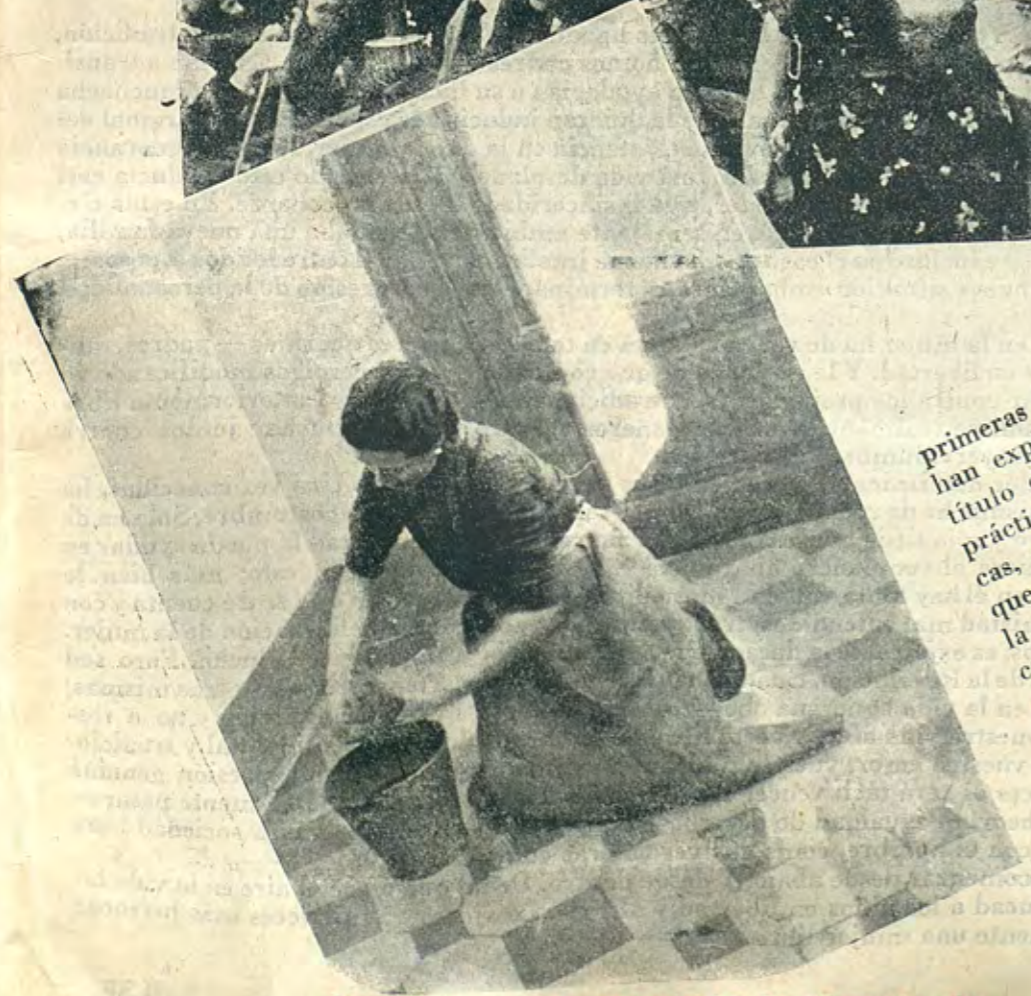
Cada una en su puesto, necesarias las dos, eficaces las dos, desempeñan trabajos divergentes, pero complementarios. Compañera X, compañera Federica Montseny, compañeras las dos.

ya no es aquella señorita gris, de vestimenta que, hipócritamente recatada, posaba en toda posible víctima masculina el trabajo físico y resignada por pseudoemancipada, de carrerita por a todo sentimiento humano su casa», condensación antisociales. Ido jado a