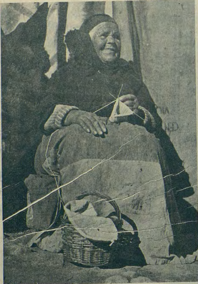
A esta magnífica viejecita de Aragón, los años le han aumentado la energía y teje prendas para el frente

Pero ¡ya funcionamos otra vez! Controlados e intervenidos por nuestros clientes, y por tanto, funcionamos muy mal. Los celosos, los pesimistas, los amargados, los melancólicos... ¡Ah, camarada visitante! Desde que el Sanatorio está controlado, nadie lo limpia, nadie lo atiende nadie, se esmera, y el Comité número 10.084.653.926.800 de la España leal, hace sus deliberaciones en la galería de curas, de espaldas a la Vida y el Sol.