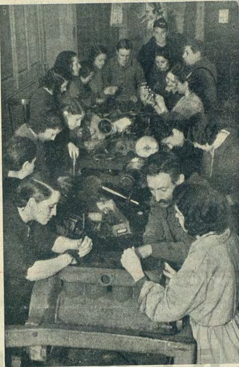
Ahí está la magna obra del Sindicato del Transporte, instruyendo en la mecánica y conducción de automóviles el primer grupo de muchachas, constituido por cerca de 40 compañeras de esta Agrupación.

En marcha este primordial aspecto — primordial por las circunstancias que rodean la vida de Madrid—, comenzamos a ocuparnos con mayor atención de las cuestiones culturales propiamente dichas. El primer paso será abrir muy en breve unos cursos de instrucción primaria, de la que, doloroso es confesarlo, está bien necesitado un elevado porcentaje de mujeres. Progresivamente iremos abriendo cursos de ciencias, reservando nuestro mayor interés para las cuestiones sociales y económicas. El alejamiento de los frentes de guerra de Madrid habría de contribuir a impulsar poderosamente esta labor.