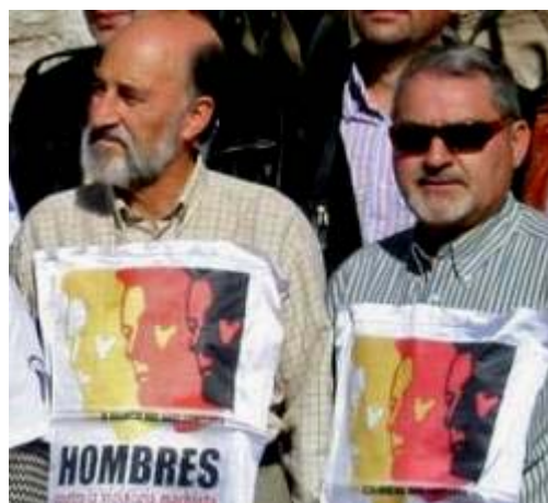
Dos de los hombres que participaron en la concentración contra la violencia machista.

El manifiesto concluyó animando a las mujeres que se encuentren en esa situación a que lo denuncien legal y socialmente. "Rompamos, pues, el silencio quienes padecen la violencia por parte de sus parejas son ante todo seres humanos que sufren y además y por desgracia inútilmente. La vida nunca, nunca consistirá en eso precisamente, la vida es de lo que estamos tratando de hablar, no de la muerte".