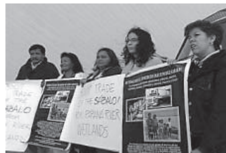
ONGs de varios países, miembros de la Coalición Ríos Vivos e indígenas, se sumaron a la petición de boicot al comercio internacional del sábalo ( Prochilodus platensis ).

Más información: pescaproteger@arnet.com.ar www.amigosdelatierra.org.ar