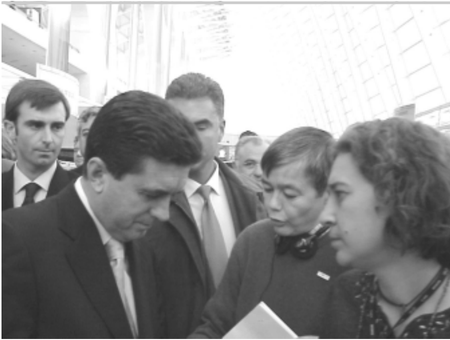
Representantes de las ONGs y Comunidades Locales entregan las conclusiones de la Conferencia al Ministro de Medio Ambiente español.