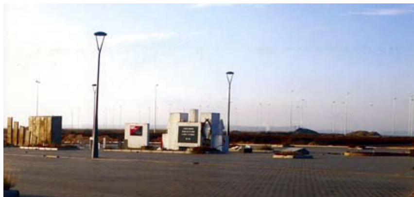
Fotografía de Los Pozos de Caudé

14,00 h.- Clausura del acto y despedida de asistentes