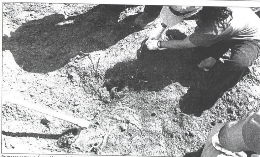
Primeros restos de los cadáveres de los soldados fusilados descubiertos ayer en Piedras Gordas, Rubielos de Mora