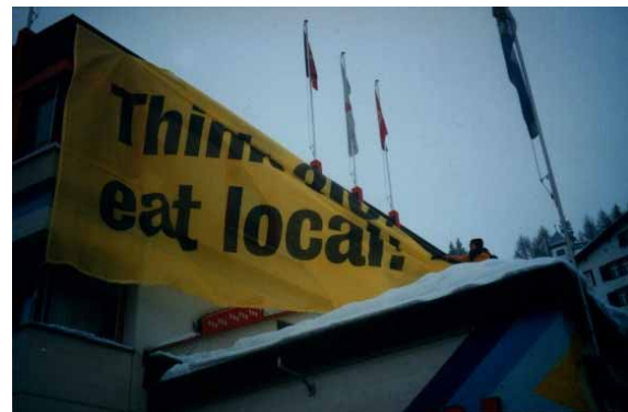
"Pensa globalment, menja localment"