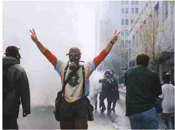
Un manifestant en Seattle alça els braços fent la senyal de la victòria mentre la policia llança pots de fum contra els manifestants

Tot això no es pot entendre sense analitzar el seu context: per una banda, si determinats governs plantejaven demandes socials ho feien perquè sentien en la nuca l'alè dels sindicats i demés