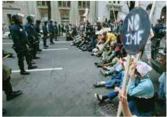
Davant la cimera del F.M.I. 18 d'abril del 2000

L'esclafit de Seattle, en definitiva, significava la sortida a la llum d'una crisi del neoliberalisme que es venia desenvolupant en el darrer període, tant en l'àmbit financer com en l'àmbit polític. I marcava també la senyal del pas a l'ofensiva dels moviments internacionals contra el neoliberalisme i el capitalisme. Les protestes al voltant del Fòrum de Davos i la cimera del Fons Monetari Internacional en Washington han estat les següents fites d'aquesta ofensiva que marca l'inici del nou mil·lenni. Contribuir a la seua extensió i aprofundiment és el nostre repte.