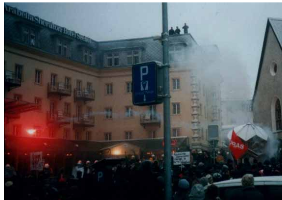
Protesta davant del Fòrum Econòmic Mundial en Davos

manifestants. Però per altra banda, les característiques d'aquests governs els feien susceptibles a la pressió popular, en haver sortit d'eleccions que havien donat lloc a coalicions d'esquerreres o si més no havien