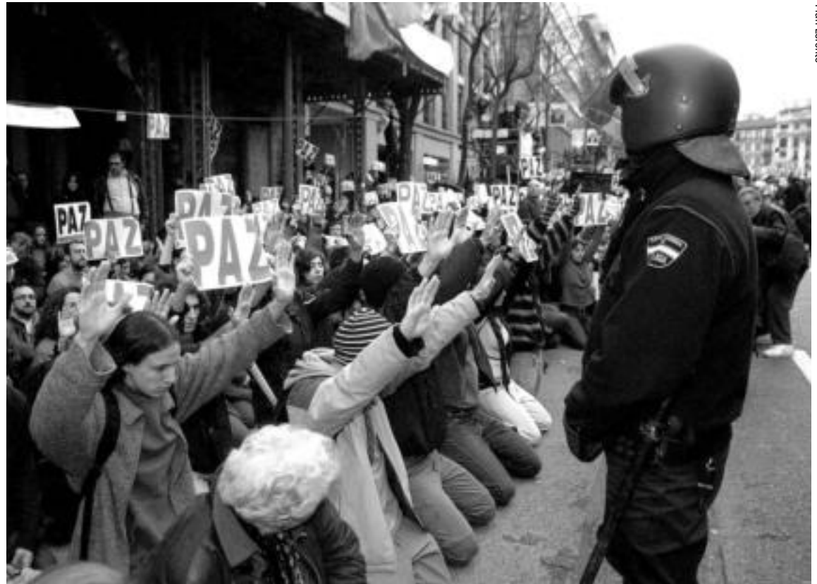
MANIFESTANTES EN LA CALLE GÉNOVA. Las protestas comenzaron a las 18h. frente a la sede central del PP en Madrid.

La noticia saltó a las seis de la tarde. En Madrid, en la calle Génova, 200 personas se concentraban en la sede del Partido Popular. En poco más