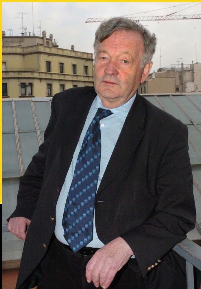
Theo Van Boven

Nos enfrentamos a un verdadero recorte de las libertades de expresión, a un ataque a la pluralidad informativa, al derecho al desarrollo de la cultura y la lengua vasca y un ataque a los derechos humanos por las torturas sufridas.