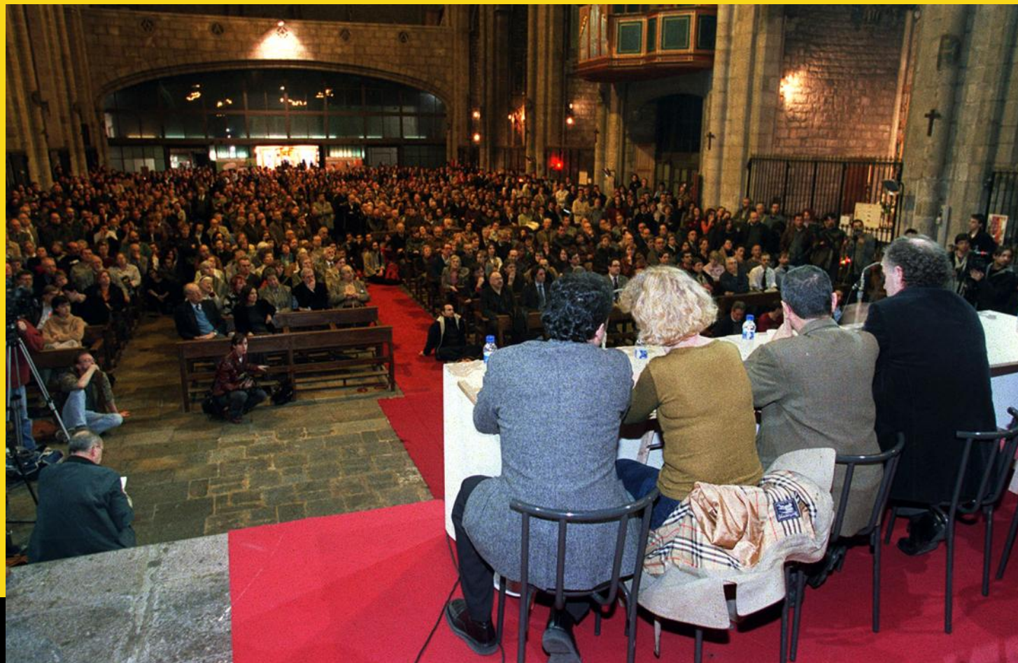
Imagen de un acto a favor de 'Egunkaria' celebrado en la Iglesia de Santa María del Pi de Barcelona el 10 de marzo de 2003.