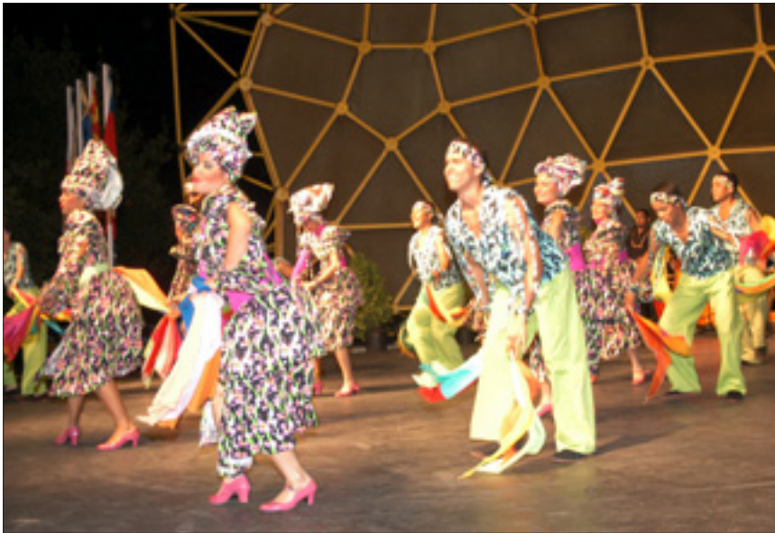
Colorido, ritmo y música en la actuación de la Compañía de Danza Zazaribacoa de Venezuela. CUEVAS

Actuaron en el Auditorium grupos de varios países y comunidades