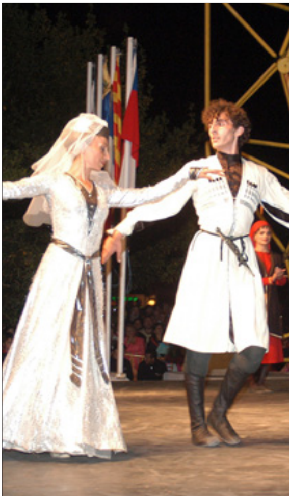
Pareja de bailarines del Ballet Folclórico Nadzbruchanka, de Ucrania. CUEVAS

La organización del Festival celebrado en la capital del Besaya fue obra de la Agrupación de Danzas Virgen de las Nieves de Tanos que contó con el patrocinio de la Consejería de Cultura, Turismo y Deporte del Gobierno de Cantabria y la empresa Solvay Química.