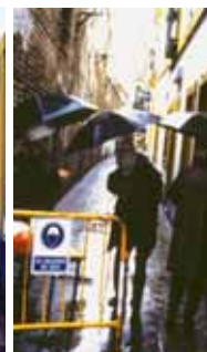
1 foto > Valle Teba 1999