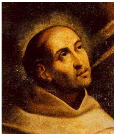
San Juan de la Cruz. Anónimo.

26. San Juan de la Cruz (1542-1591). Cofundador de los carmelitas descalzos. Nacido en Fontiveros (España). Doctor en teología mística. Aclamado el 24 de agosto de 1926 por Pío XI.