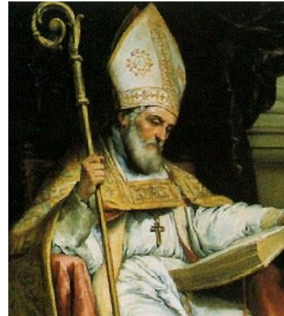
San Isidoro de Sevilla. Murillo (1655).

25. San Pedro Canisio (1521-97). Teólogo jesuita. Nacido en Nimega (Holanda). Líder de la contrarreforma. Aclamado el 21 de mayo de 1925 por Pío XI.