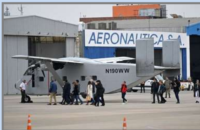
Foto: El avión usado en los vuelos de la muerte.

Cristina Kirchner, Sergio Massa y el avión de los "Vuelos de la muerte" Ambos reivindicaron la decisión de recuperar el avión. Cristina Kirchner se mostró a favor de una ley "contra el negacionismo".>>>