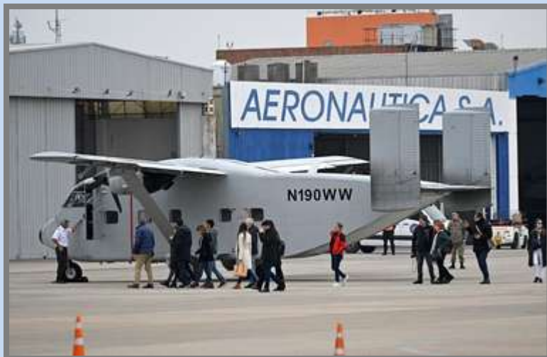
El Skyvan llegó este sábado al Aeroparque Jorge Newbery

25 de Junio - Regresó desde Estados Unidos. Por Luciana Bertoia