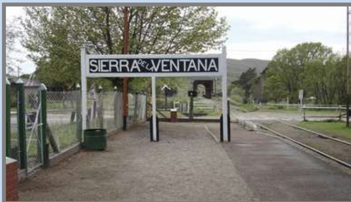
Imagen: Estación "Sierra de la Ventana y, (al fondo el puente) con la Baldwin pasando el puente sobre "El Sauce Grande"