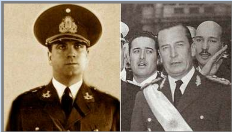
Imagen: General Juan José Valle y P. E. Aramburu

Por este método solo han logrado hacerse aborrecer aquí y en el extranjero.