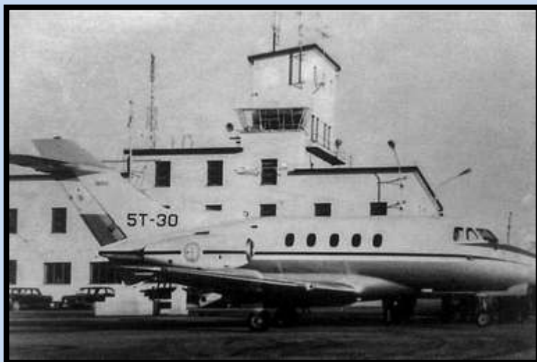
Imagen: el Avión

Piden preservar la aeronave que fue localizada en mal estado en Uruguay