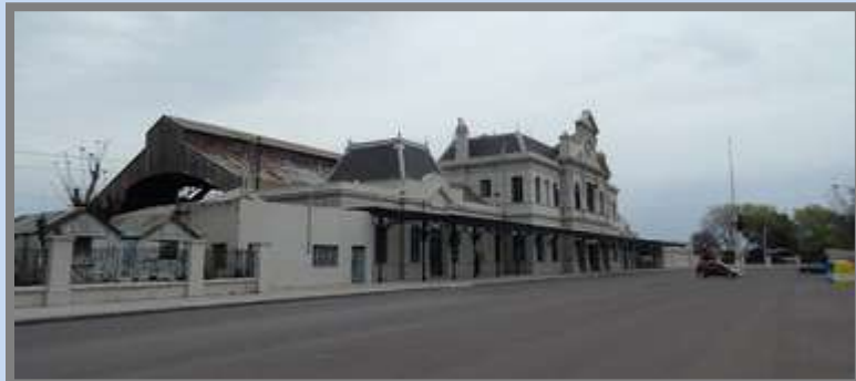
Foto: Estación Bahía Blanca Sur de la Línea Roca

La empresa Trenes Argentinos Operaciones informa que el servicio de pasajeros entre Plaza Constitución - Bahía Blanca de la Línea, comenzará a funcionar nuevamente mañana. Los boletos para este primer viaje y su vuelta han sido adquiridos en su totalidad.