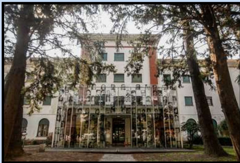
Cuatro ex alumnos de la ESMA que participaban del grupo de tareas fueron procesados por secuestros y torturas.