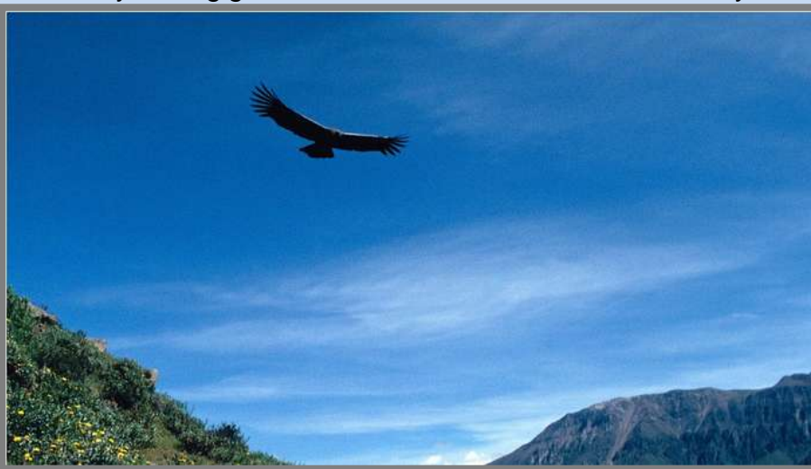
Foto: Un cóndor sobrevolando el Valle del Colca, en los Andes peruanos. (Andoni Canela)

30 de Mayo - El gigantesco cóndor andino: una de las mayores aves del planeta. Por Andoni Canela