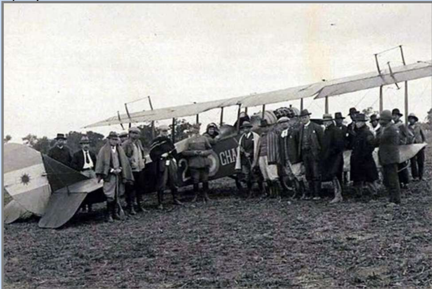
Imagen: Los estancieros de la época posan junto al avión que sirvió para disparar desde el aire a mujeres y niños.

"Todo está guardado en la memoria" dice el conmovedor tema que León Gieco lanzó en 2001 para homenajear a las víctimas de la AMIA. Hoy cabe recordar esa canción con especial énfasis porque, justo al cumplirse 98 años de la más brutal y vergonzosa matanza cometida por el Estado argentino contra un pueblo originario, se ha hecho Justicia.