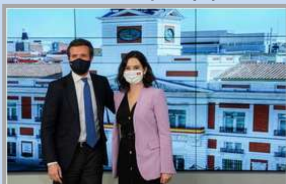
Imagen: Pablo Casado junto a Isabel Díaz Ayuso, los tiempos de armonía se han quebrado en el PP

Acusaciones de espionaje y de cobro de comisiones ilegales