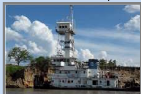
Imagen: El remolcador de empuje "Piray Guazú"

24 de Febrero - El Piray Guazú y la bandera. Por Mempo Giardinelli