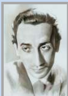
Ilustración: Víctor Augusto Peña

Compositor, dramaturgo, actor y hombre de cine, el autor de “Cambalache” interpeló a la sociedad argentina de su tiempo con la mordacidad de sus creaciones. El filósofo del tango, como se lo supo considerar, fue un artista integral, cuya obra lo trasciende y tiene vigencia hasta nuestros días.