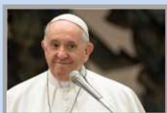
Imagen: Otro llamado de Francisco a la solidaridad y protección de lo más débiles

En una entrevista Francisco evocó su niñez en Buenos Aires