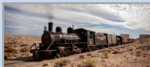
Imagen: Durante esta temporada, el mítico tren de trocha angosta y locomotora a vapor, cuenta con salidas programadas para todos los sábados de enero, febrero y marzo y el 16 de abril para la Semana Santa.

El servicio volvió a ponerse en marcha para que residentes y turistas puedan vivir la experiencia de transitar los majestuosos paisajes que conforman la estepa patagónica a bordo de la antigua formación ferroviaria, que recorre unos 43 kilómetros.