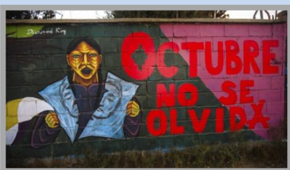
Imagen: La CIDH presentará un informe final sobre las vulneraciones de derechos en el golpe de 2019. Foto: Satori Gigie

La CIDH presentará un informe final sobre las vulneraciones de derechos en el golpe de 2019. Foto: Satori Gigie Una recorrida por el barrio de Senkata, en las afueras de El Alto, el escenario de una de las mayores masacres perpetradas por el gobierno de facto de