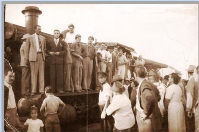
Imagen: Acto de festejo en la estación Carhué el día que el General Perón nacionalizó los Ferrocarriles (La nota es del 13 de Febrero de 2007).

Uno de los hechos más importantes realizados por la revolución Peronista fue la compra de los Ferrocarriles ya que es visto como un logro clave para la consolidación de la independencia económica, dado que estos transportes eran utilizados por el imperio británico para transportar y posteriormente retirar del país granos, carnes y alimentos en general, aquellos ferrocarriles que estaban direccionados hacia el puerto, cubriendo en forma de