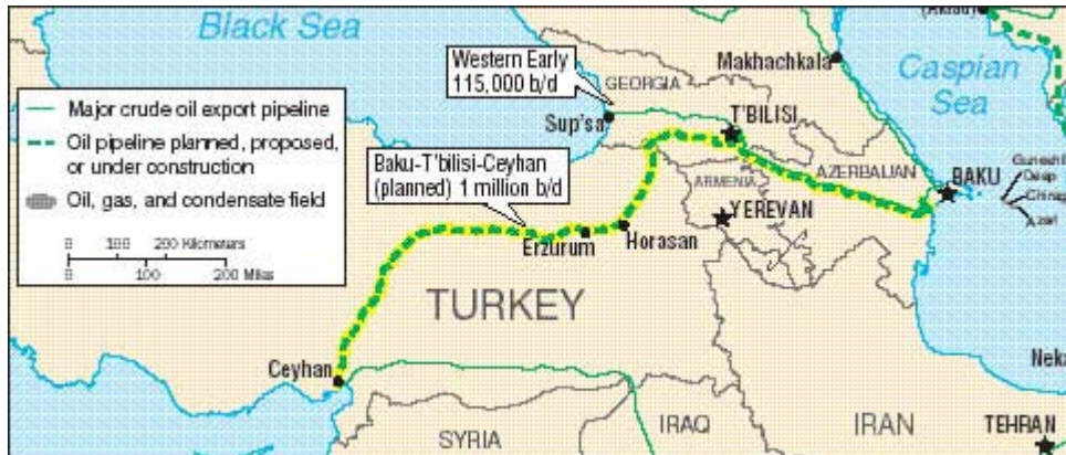
Fig.:A2 ORIENTE MEDIO: OLEODUCTOS Y GASODUCTOS

Los accionistas de BTC Co. son: BP (30.1%); AzBTC (25.0%); Chevron (8.9%); Statoil (8.71%), TPAO (6.53%); Eni (5.0%); Total (5.0%); Itochu (3.4%); INPEX (2.5%); ConocoPhillips (2.5%); Amerada Hess (2.36%)