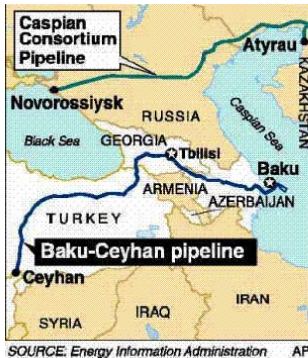
Fig. 1. OLEODUCTO CONSORCIO DEL CASPIO - OLEODUCTO BAKÚ-CEYHAN