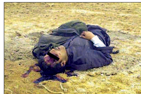
Un detenido iraquí asesinado por las fuerzas de ocupación de EEUU en la prisión de Abu Ghraib

Hace ahora tres años las calles de todas las ciudades del mundo se llenaron de millones de manifestantes que protestaban contra aquella mal llamada guerra en la que fue una de las más grandes movilizaciones mundiales que hasta hoy hemos conocido. En el terri-