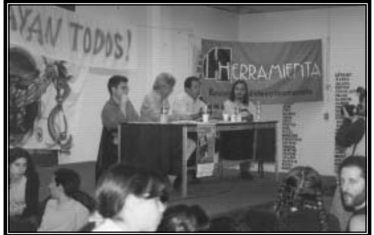
Presentación del libro en Argentina.

movimientos que tratan de encontrar nuevas formas de expresar el grito y cuando se extienden los movimientos, cuando se extiende este tipo de música, obviamente hay un