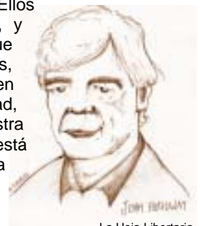
La Hoja Libertaria

El concepto de la dignidad surge –no por primera vez– pero muy claramente con los zapatistas. Ellos se levantan hablando de dignidad, y dignidad para mí es la idea de que somos humanos, somos sujetos, somos hacedores, somos activos, en ese sentido tenemos una dignidad, pero al mismo tiempo nuestra humanidad, nuestra subjetividad está negada. Nuestra dignidad implica luchar contra su propia negación, implica luchar por un mundo donde la dignidad esté reconocida, donde