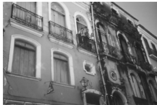
Fachada del centro cultural anarquista: Quilombo Cecilia.