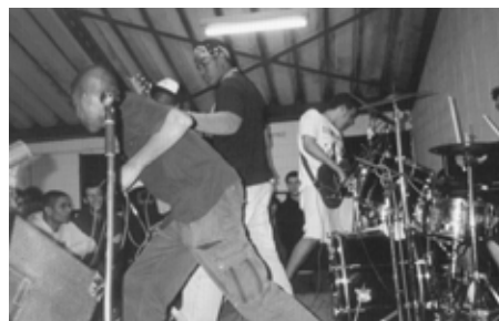
Banda de H.C. Straight Edge: SEM ACORDO

Finalizado el encuentro nos invitaron a conocer un terreno ocupado de punks y hippies que cuenta con muchos años