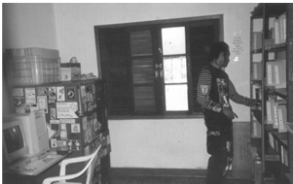
Biblioteca del Squat: La Comuna Goula Polé.