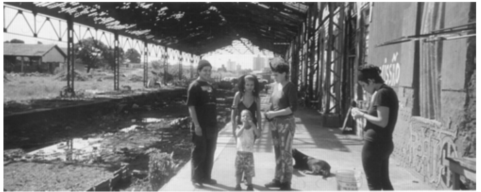
Bompa Negra (Paloma Negra), una de las ocupaciones más grandes de Brasil.

formación, un pequeño gimnasio donde todos los días están entrenando, además de los que ocupan la casa, mucha gente del barrio vienen a practicar en el gimnasio la mayoría de ellos se encuentran muy preparados para la autodefensa ya que en las calles de San P. Hay bastante peligro con los carecas (boneheads, ó también erróneamente conocidos como