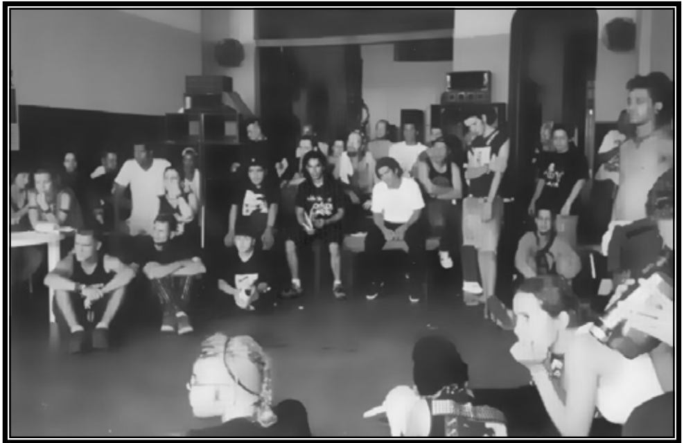
Una de tantas reuniones en el Encuentro Internacional AnarcoPunk.

Algunas de las temáticas que se trataron son: La Globalización y experiencias anticapitalistas (asuntos y estatus de la configuración mundial, experiencias anticapitalistas en el mundo, que tipos de lucha son viables, cuál es la cuestión más urgente de la lucha revolucionaria, etc. ), El movimiento Punk y la inserción social (la resistencia del movimiento Punk, la comercialización del Punk, la cultura punk y las relaciones interétnicas), Cárceles y vigilancia policial, Sexualidad y Punk (homosexualismo y anarcofeminismo), Squats (casas ocupadas) y centros culturales. Algo muy interesante fue la presentación de videos diariamente por compas