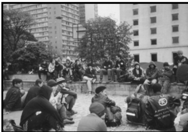
Reunión de UMP en San Paulo.

La primera asamblea que se realizó en el encuentro internacional fue por la mañana el 23 de julio, los primeros problemas a resolver fueron la cuestión de la seguridad en el encuentro, para resolverlo se formo una comisión de seguridad, y para ver las otras cuestiones de logística se resolvieron por medio de la participación voluntaria y coordinación. Después se dio paso a la presentación de los participantes del Encuentro Internacional con asistencia de 85 personas en los primeros días, que