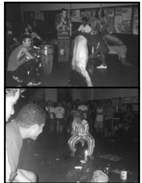
Teatro, y Capoeira Angola presentes en el encuentro.