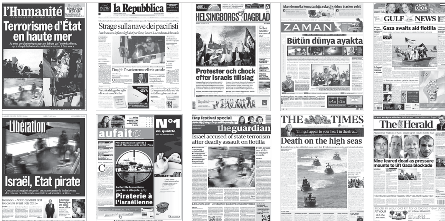
HEMEROTECA. La reacció i la condemna, generalitzada.

Manu Simarro redaccio@setmanaridirecta.info