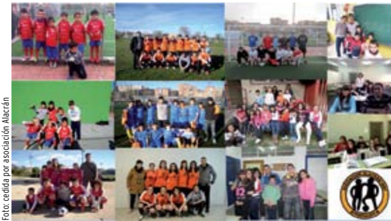
Más de 150 chicos y chicas juegan al fútbol en el Alacrán.

Ahora tienen equipos en las categorías prebenjamín, benjamín, alevín, infantil, cadete y senior. “Trabajamos con el deporte la parte de ocio; en la parte más educativa damos apoyo escolar a los chavales, y, por último, está la parte social, en la que atendemos a chavales en