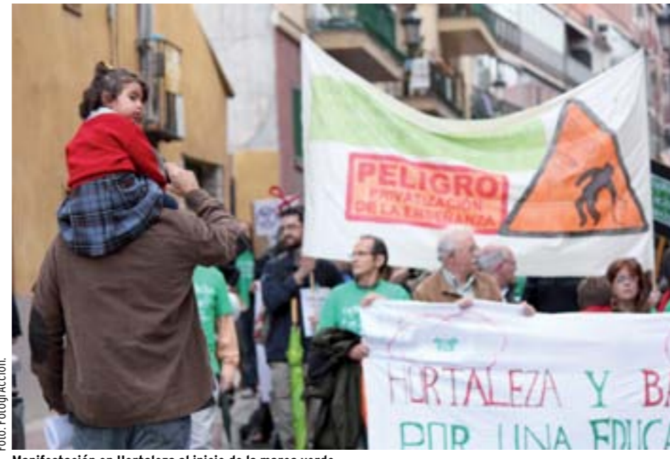
Manifestación en Hortaleza al inicio de la marea verde.

Respecto a la política educativa, “las pruebas de CDI que la Comunidad de Madrid hace a alumnos de 6º de Primaria corresponden este año a un nivel muy inferior, pues los buenos resultados