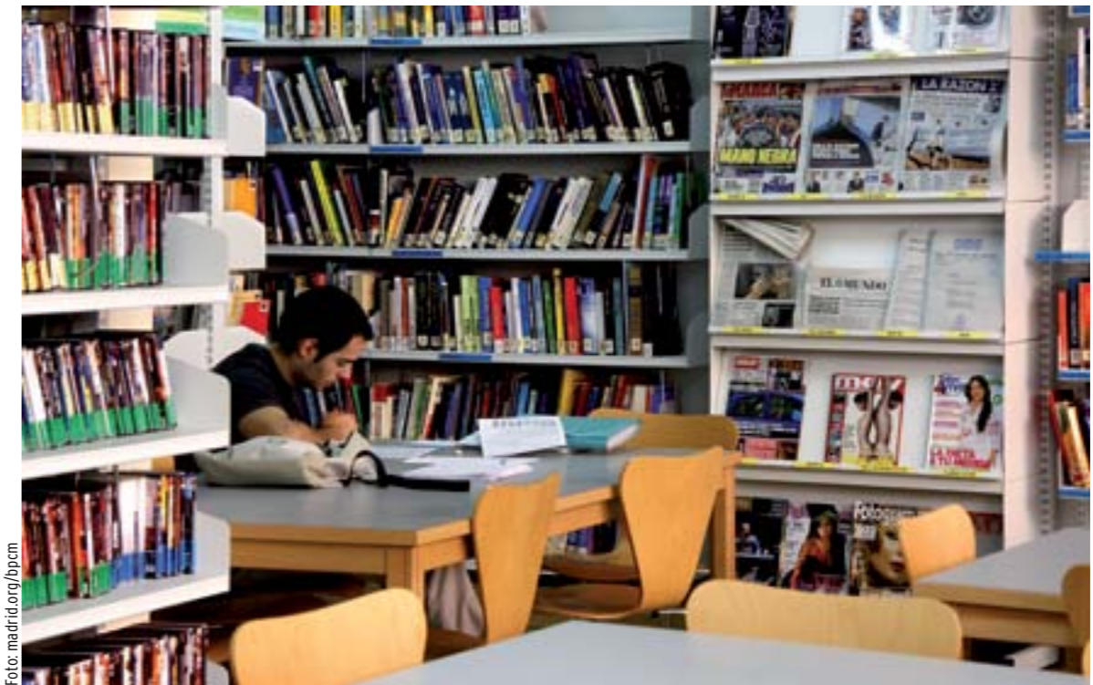
Sala principal de la Biblioteca Pública de Hortaleza, en el CEPA Dulce Chacón.

En Hortaleza, sólo dos bibliotecas dan servicio actualmente a sus más de 174.000 habitantes, con el inconveniente –según han expresado a este periódico numerosos usuarios a las puertas de estos centros– de que son “muy pequeñas” y, además, están “muy cerca la una de otra”, en un