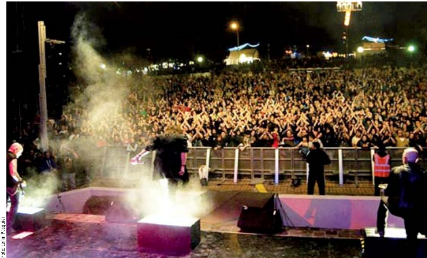
Imagen del auditorio durante el concierto de Obús el pasado 25 de mayo.

A pesar de todo, las Fiestas podrían haber sido todavía más austeras. Finalmente, los feriantes han aportado 50.000 euros para la contratación de artistas. Aun así, el presupuesto apenas alcanza para tres actuaciones importantes. De este modo, la Junta de Hortaleza ha tenido que aumentar el número de asociaciones participantes para completar la programación de las