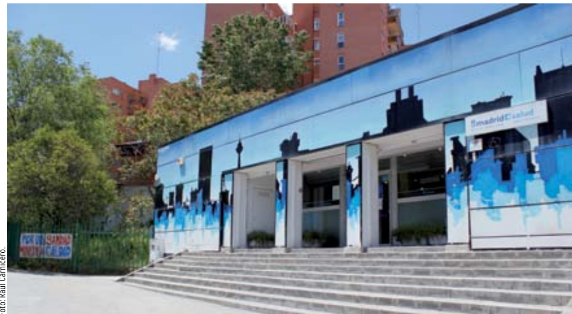
El CAD de Hortaleza, en la calle Minaya, es uno de los siete que existen en la ciudad.

Atención a las Drogodependencias) al Gobierno regional y, como muchos temen, bajo manos privadas. Uno de los siete centros CAD que existen en Madrid capital se ubica en Hortaleza (c/ Minaya, 7), donde