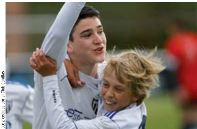
1. Jugadores de la cantera del Canillas celebran un gol. 2. El entrenador portugués José Mourinho, celebrando su cumpleaños en las instalaciones del club. 3. El exfutbolista francés Zinedine Zidane, junto al presidente del Canillas, Manolo Álvarez.

arranque de inocencia (o no), afirmó públicamente que el técnico le había asegurado que la temporada que viene no podría seguir apoyando al Canillas porque no estaría aquí. El huracán que levantaron estas declaraciones y sus desmentidos posteriores consiguió que en menos de un mes se habla-