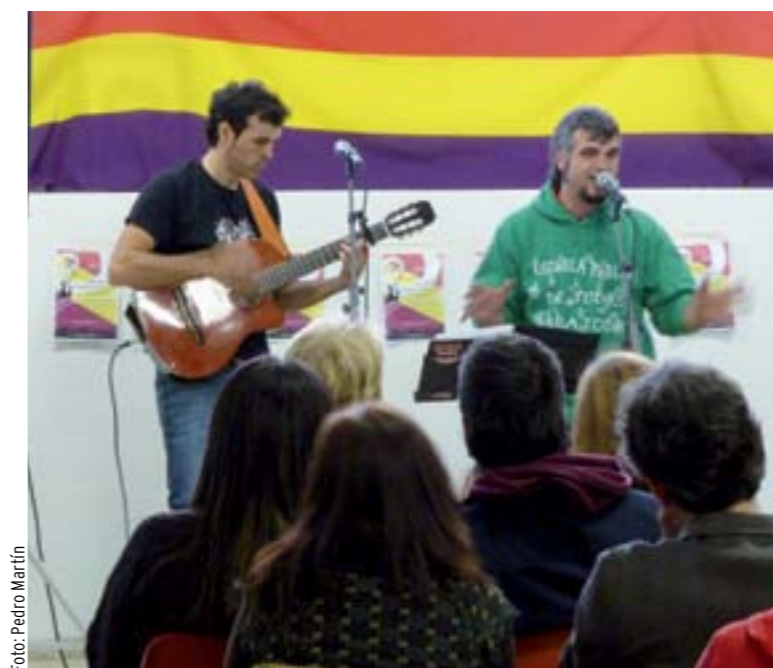
Un momento de la actuación del grupo Rojo Cancionero.