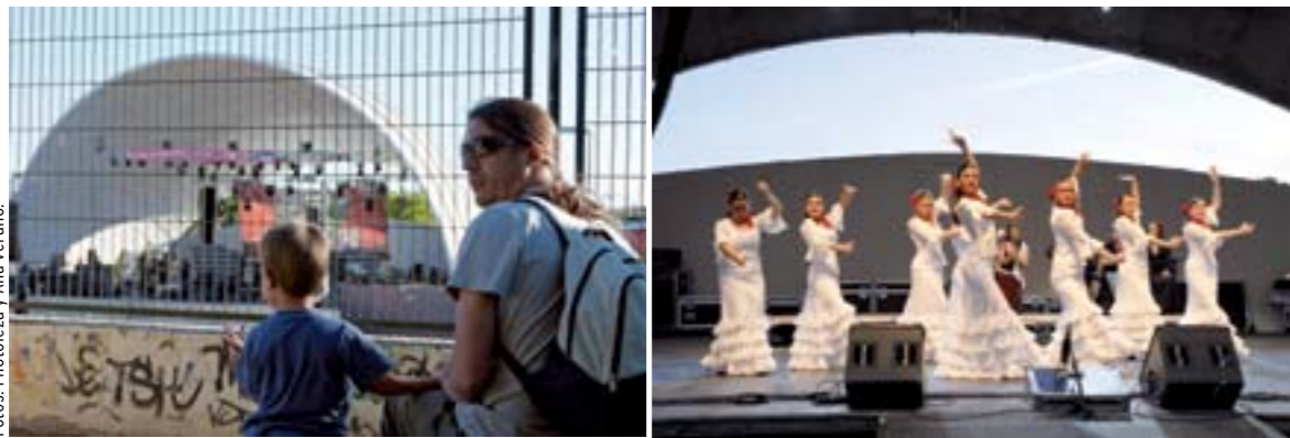
Las Fiestas de Hortaleza se celebran del 24 de mayo al 2 de junio en el parque Pinar del Rey.

del año pasado. Recortes que en la Junta de Hortaleza siempre se justifican con una frase: "No hay tanto dinero como antes", sin aludir a la millonaria deuda acumulada durante los mandatos de Gallardón. En realidad, el ahorro en las Fiestas resulta insignificante, porque los festejos apenas representan el 0,009% del presupuesto total del distrito, que asciende a los 24 millones de euros. Y contrasta con