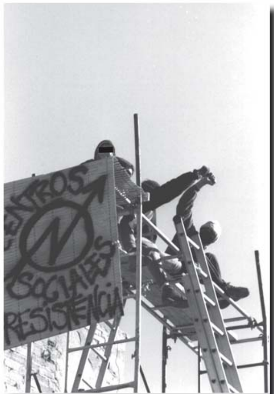
«Sólo la colaboración de los bomberos logró desalojar a l@s compañer@s del andamio»