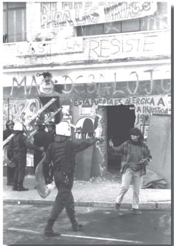
Policía y bomberos desalojando el CS «David Castilla»

Las acciones de protesta no son muy contundentes: la misma noche del desalojo, un grupo de jóvenes queman un cajero de caja Madrid, levantan una