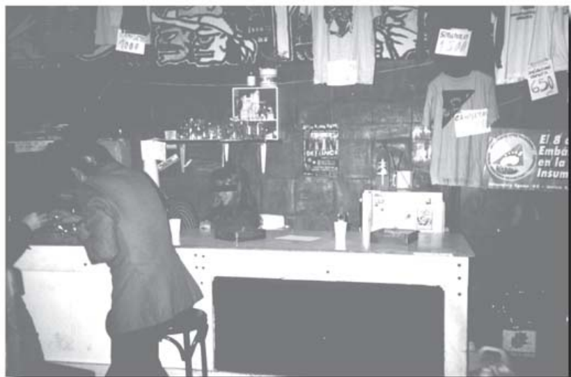
Bar-Centro de información del CS «David Castilla»

Lo primero que hicimos fue unas jornadas sobre okupación, para explicar a los