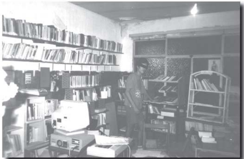
Biblioteca del Centro Social «David Castilla»

vecinos lo que queríamos hacer y para dar a conocer el CS, dirigido a los vecinos más que al movimiento autónomo (buzoneábamos propaganda de todas las actividades.) Pero no tuvieron mucho éxito, luego nos dimos cuenta que al principio el barrio a lo mejor no está en contra pero necesita un tiempo para hacerse a la idea de tu presencia y luego dar el paso de interesarse por lo que tú haces. Pero aunque nosotros empezamos al revés, terminó habiendo muy buena relación con los vecinos. Las Asociaciones de Vecinos no se atrevían a pasar del apoyo testimonial, al igual que con el KAT.