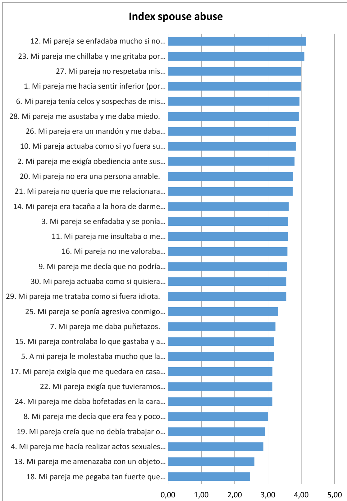
Figura 2. Puntuaciones medias obtenidas en los ítems del Cuestionario ISA.