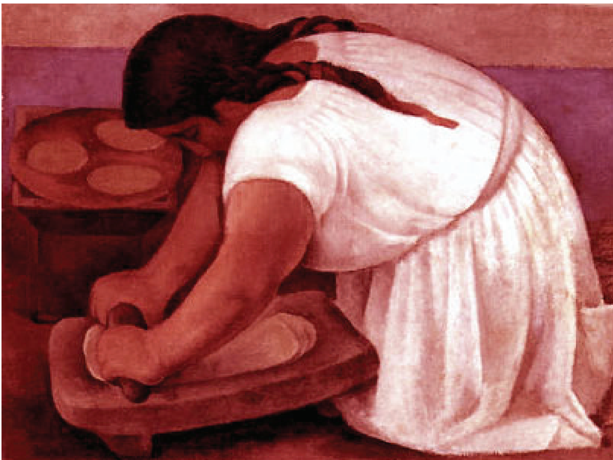
Diego Rivera. Molinera

Mucho nos queda debatir sobre el PP, pero desde ya debemos ir apuntando hacia un concepto más profundo y menos reduccionista que el que han estado repitiendo corrientes reformistas.