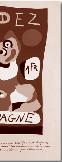
AIDEZ L'ESPAGNE. Joan Miró