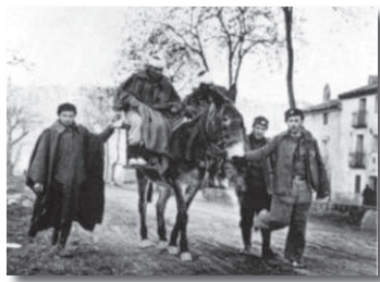
Teruel en invierno.