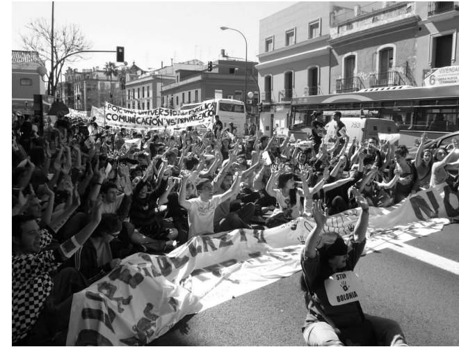
estudiantes en una de las protestas antibolonia.

El Plan Bolonia ha supuesto, aunque tarde, el arranque de las protestas en las universidades españolas. Los estudiantes nos jugamos el futuro de la universidad pública y de la calidad en los contenidos. Los presupuestos para educación superior, siempre escasos, se quedarán más cortos todavía porque aplicar los contenidos de Bolonia conllevará o más dinero para la universidad o más precariedad en la impartición de los programas docentes