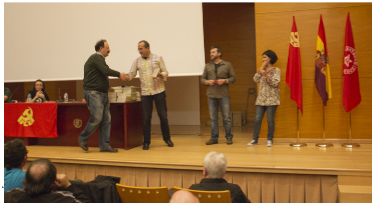
Diferentes momentos de la entrega de carnets a la nueva militancia del Partido y la Juventud