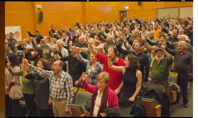
Cantando La Internacional al concluir el acto