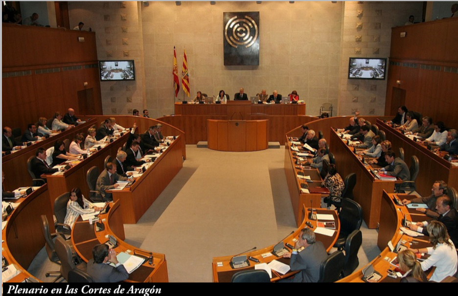
Plenario en las Cortes de Aragón

Las Cortes de Aragón, con el voto de PP y PAR, han aprobado unos presupuestos con un recorte del gasto respecto a 2012 del 3,42% (172 millones). En Sanidad, Bienestar Social y Familia la reducción es de 287 millones (-13,3%); en Agricultura, Ganadería y Medio Ambiente de 111 millones (-13,8%); y en Educación, Universidad, Cultura y Deporte de 110 millones (-10,8%).