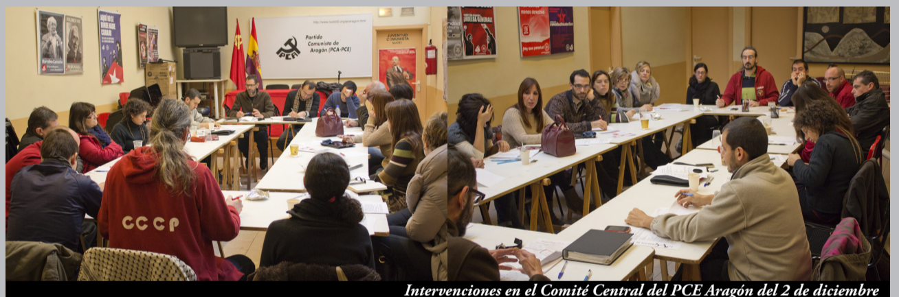
Intervenciones en el Comité Central del PCE Aragón del 2 de diciembre

En el punto de varios se informó de las movilizaciones más próximas, como la concentración del 6 de diciembre convocada por el MP3.