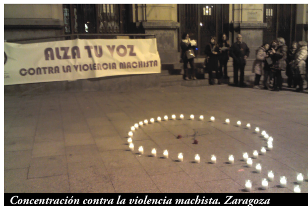
Concentración contra la violencia machista. Zaragoza

La crisis actual en España, el gobierno del PP, la Iglesia, etc., nos quieren implantar una ideología neoconservadora que supone una grave agresión a la vida de las mujeres y que aumentará sin duda la violencia ejercida contra nosotras.