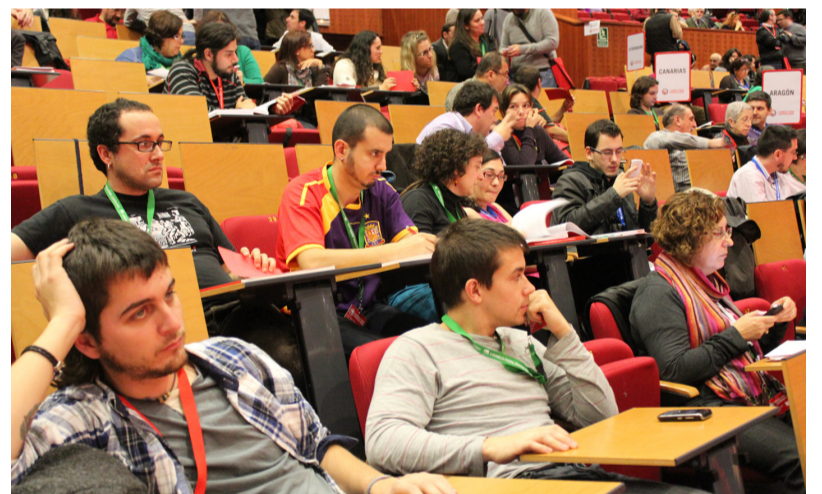
Momentos de descanso en el Plenario

Como digo nuestro coordinador Cayo Lara en el Informe de Gestión, hemos pasado de preguntarnos si IU tenía futuro a preguntarnos “¿Qué futuro tiene que construir IU?”