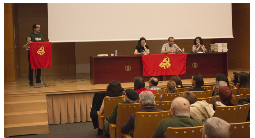
Presentación del acto por parte del S o del Comité Central del PCE Aragón

Camaradas nuevos que harán más fácil el trabajo en los frentes donde el Partido prioriza sus esfuerzos, facilitando con ello continuar ganando la hegemonía política y no solo la numérica, con el claro objetivo de conseguir una sociedad radicalmente democrática, una sociedad comunista.