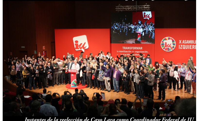
Instantes de la reelección de Cayo Lara como Coordinador Federal de IU