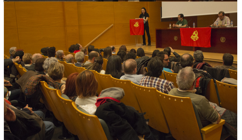
Intervención de la Responsable Política de la UJCE Aragón