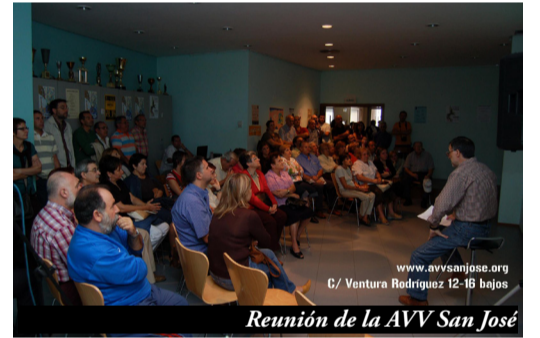
Reunión de la AVV San José

El movimiento vecinal vive la crisis de los 40 justo en medio de una gigantesca crisis sistémica, en apariencia como la que lo vio nacer allá por los 70, aunque bien poco similar. Su propia crisis viene de lejos, es de calado y sin fácil solución, porque en muchos de sus síntomas coincide con otros movimientos sociales. Se ha dejado por el camino el carácter “político” que clara y orgullosamente le identificaba cuando planteaba demandas, propuestas, movilizaciones, gobernasen los tirios, o los troyanos. Ahora habla de “política” pero sólo se refiere a “instituciones” y a “partidos políticos”. Se ha balcanizado y perdido visión global de ciudad, hiper especializándose en lo que sucede o deja de suceder en su barrio, y cuidando con no meterse en otros barrios. Ha envejecido y perdido contacto con la juventud, que o se ha marchado a nuevos barrios, o está políticamente desmovilizada. También ha sido maltratado como correa de transmisión partidista, en función de quien gobernara, y ha visto que la democracia participativa no ha pasado casi nunca, y como mucho, de su fase programática. Es tiempo de mirar atrás, pero sin romanticismo, porque el futuro está justo en dirección contraria.