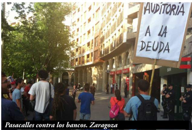
Pasacalles contra los bancos. Zaragoza

Algunas de ellas todavía se reúnen de forma autónoma, otras se han integrado en movimientos vecinales, y en otros barrios como San José, se ha producido un trasvase entre la Asociación de Vecinos y la Asamblea 15M, donde hay personas que trabajan en ambas. Al fin y al cabo, se encuentran en tiempo y espacio, creando una mayor fuerza social y capacidad de integración de voluntades. Este compromiso de las y los ciudadanos visualiza un proyecto de democracia participativa en el que todo está por hacer, con personas dispuestas y solidarias tanto con las que participan como con las que no. El movimiento vecinal supone