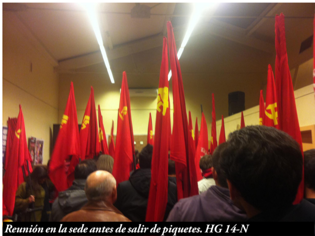
Reunión en la sede antes de salir de piquetes. HG 14-N

Por un parte, el pasado 14 de noviembre celebrábamos la segunda Huelga General del año, cosa que ocurría por primera vez en la