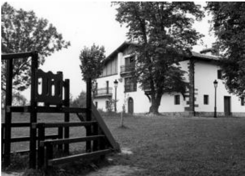
Oianguko proiektuak parkeak egun duen itxura aldatuko luke. GOIERRITARRA