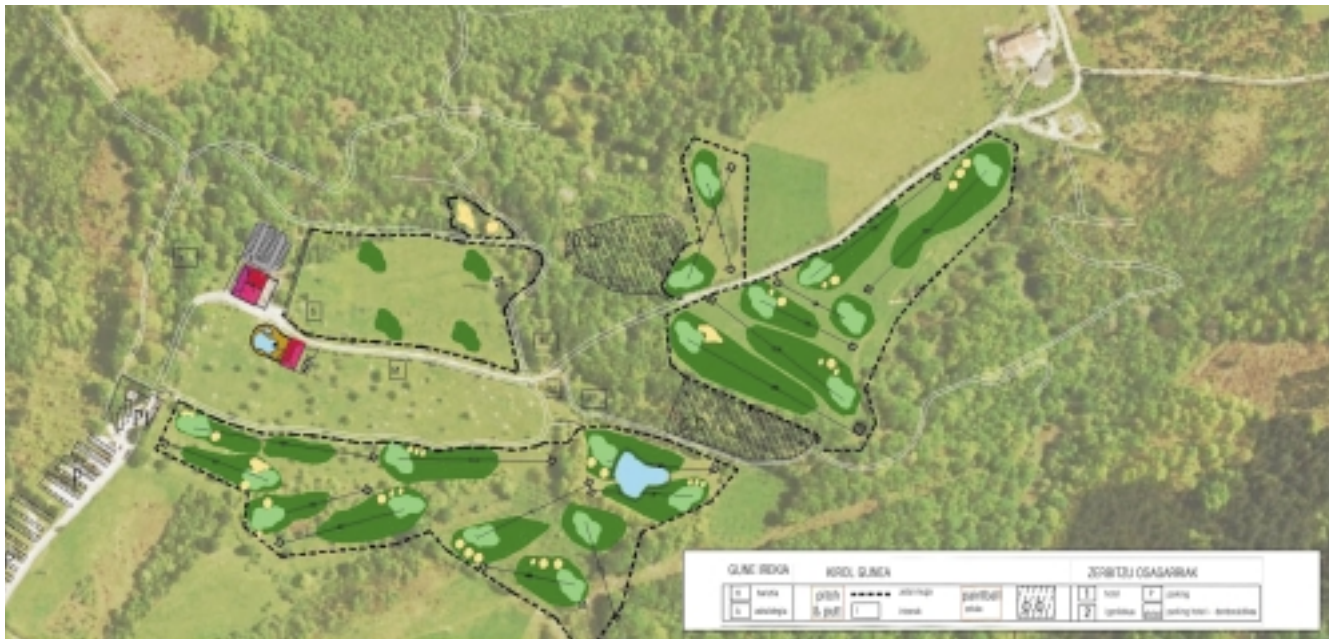
Oianguko zerbitzu berriak