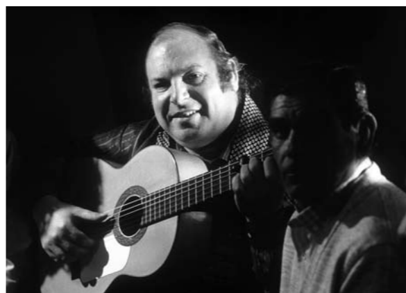
Pedro Bacán - Papel fotográfico - 18 x 25 cm