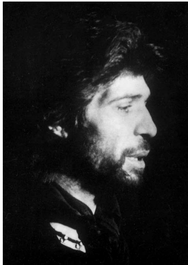
Camarón - Papel fotográfico - 64 x 45 cm