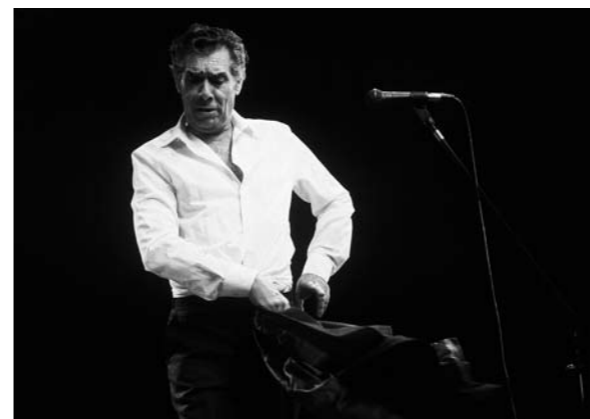
Juan El Camas - Papel fotográfico - 40 x 55 cm