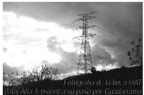
Fotografía de la línea MAT (Muy Alta Tensión) a su paso por Guadarrama

Más en: http://salvemossierra.blogspot.com