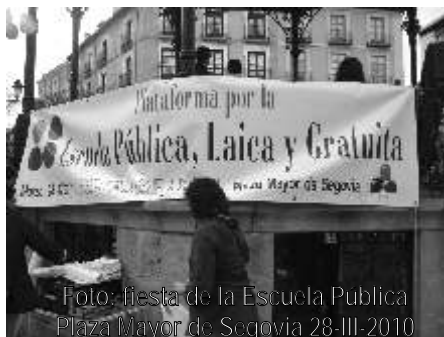
Foto: fiesta de la Escuela Pública Plaza Mayor de Segovia 28-III-2010

Jesuitas al Claret. Acogida de su alumnado por el Fray Juan Gil (Anejas) y el Domingo de Soto.