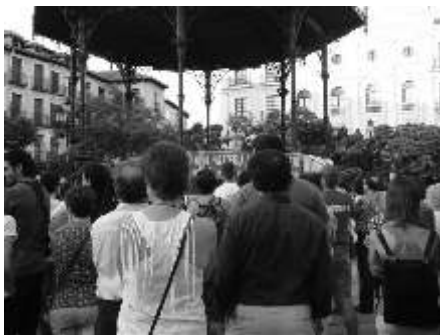
Un momento de la lectura del comunicado del Foro Social de Segovia.

Bajo el lema de la pancarta principal de la convocatoria "Juicio a la piratería asesina de Israel. Viva la lucha del pueblo palestino y los Cooperantes". "Paremos la masacre de Gaza, Segovia con el pueblo Palestino", los Concentrados han expresado su indignación de mane-