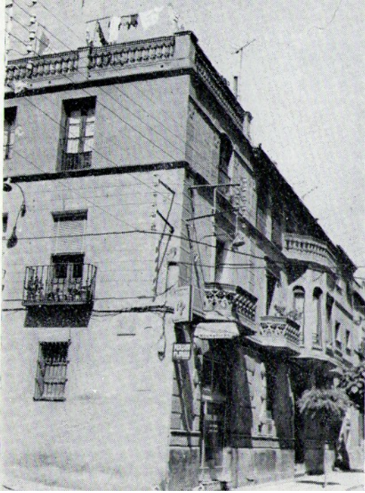
Casa Calderón de Monzón: "Escuela de Militantes"