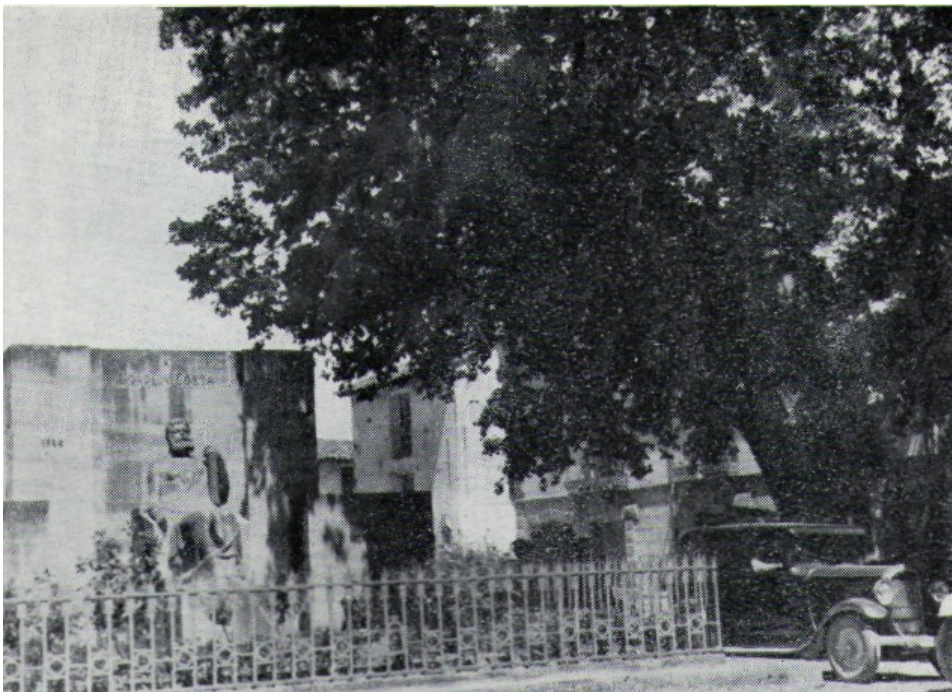
Monumento a Joaquín Costa (1846-1911), sociólogo y gran historiador. Nacido en Monzón (Huesca), fue uno de los más grandes precursores del Colectivismo Agrario y defensor del campesinado aragonés

Nuestro sindicato luchaba siempre, sobre todo para aumentar los jornales y haciendo muchas huelgas, que cada una de ellas llevaba varios compañeros a la cárcel de Huesca y comportaban clausuras del Sindicato. Cada vez que se efectuaban detenciones, el pueblo se manifestaba y protestaba enérgicamente y las autoridades, dándose cuenta de los jaleos, los ponían en libertad. Estos casos se sucedían con frecuencia; ellos cerraban el sindicato y nosotros lo abríamos, todo lo cual contribuía a la