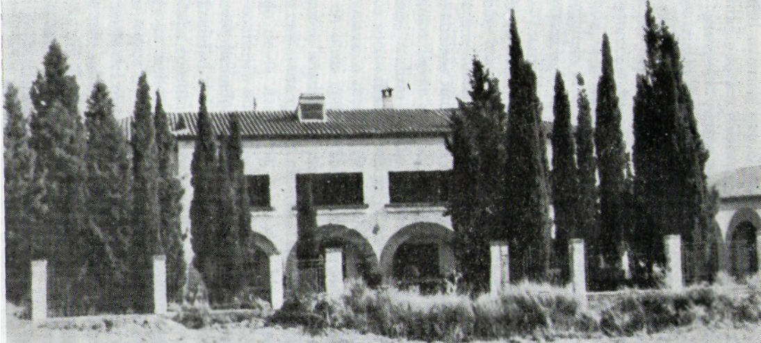
Estado actual del que fue Hospital Comarcal de Colectividades de Binéfar.

Pero también es verdad que mientras la mujer del amo puede preparar la mesa satisfaciendo las necesidades de sus hijos, en lo concerniente a la nutrición, la del jornalero tiene que hacerlo con grandes dificultades. Supongo que el doctor P. habrá observado, cuando visita a los enfermos ricos y a los casi desheredados, todos socios del Sindicato Agrícola, que existe gran diferencia entre los medios de vida de ambas categorías de ciudadanos. Nosotros deseamos que cese para siempre la explotación, que todo el mundo produzca con arreglo a sus fuerzas físicas y consuma con arreglo a sus necesidades; trabajo para todos, pan también para todos.