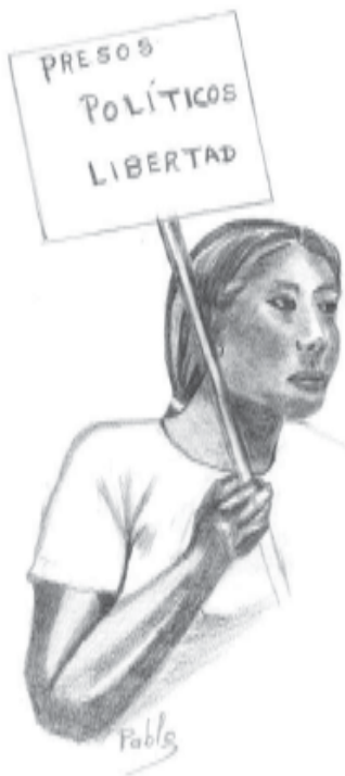
ilustración: Pablo Alvarado Flores

Parece que, efectivamente, es más cómodo luchar sólo por lo que sucedió en el pasado que continuar luchando por lo que sigue pasando hasta nuestros días. Exigir que se juzgue a los represores de ayer no conlleva necesariamente las mismas represalias que exigir que también se juzgue a los represores de hoy, de esos que ocupan