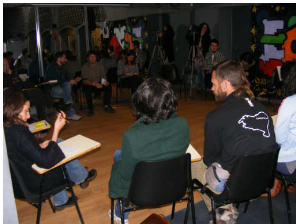
Primeira reunião do Banco de Tempo, no Espaço de Creación Joven

A reunião durou cerca de 2 horas e estiveram presentes 26 pessoas, o que foi muito motivador.