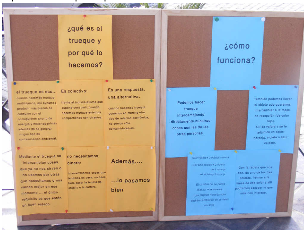
Placards realizados pelos jovens de Cala2, expostos durante os mercados para divulgação da iniciativa

Uma ideia que me pareceu particularmente interessando foi a de realizar pequenos workshops enquanto decorriam os mercados de Trueco , sempre relacionados de alguma forma com o tema. Lembro-me de me falarem de um em que ensinavam e ajudavam a fazer pregadeiras a partir de roupa usada, reciclando assim e dando uma nova forma e vida aos objectos. Parece-me que este tipo de iniciativas paralelas ajuda a promover os mercados e o tipo de atitude que se pretende.