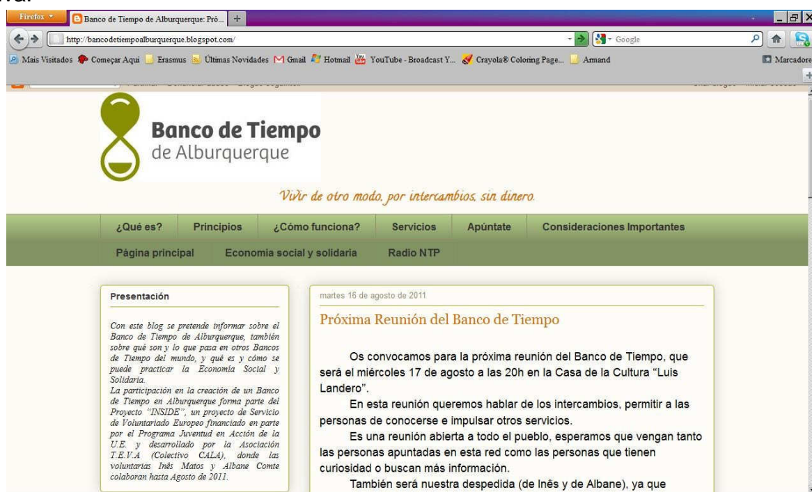
Página principal do blog

Lamento que o blog não tenha tido mais dinâmica, pois poder-se-ia ter colocado mais notícias relacionadas com as Economias Alternativas e dar outra vida ao espaço. No entanto, ficou-me claro que é necessário bastante tempo, esforço e alguns conhecimentos informáticos para manter activo e dinâmico um blog para divulgação deste tipo de iniciativa.