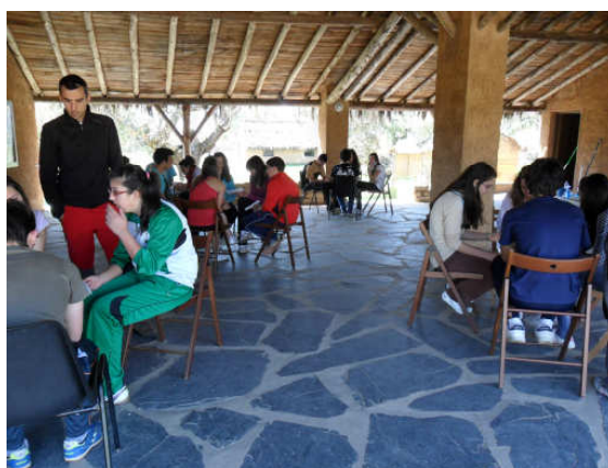
Processo de Tomada de Decisões no Encontro de Mudalmando nos Chozos (durante a dinâmica “Los Analistas”)

- por fim, pretende-se chegar a um consenso entre as propostas realizadas. Neste caso, é necessário que se façam acordos por etapas, podendo-se usar o debate ou outras técnicas de participação;