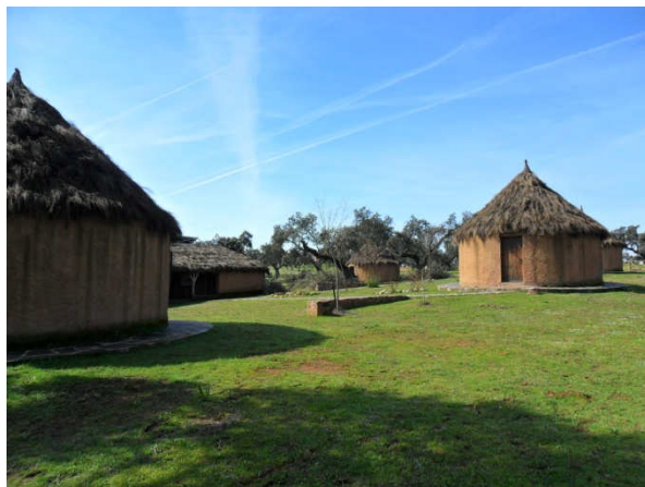
Los Chozos (entre os azinhais e sobrais à volta de Alburquerque)