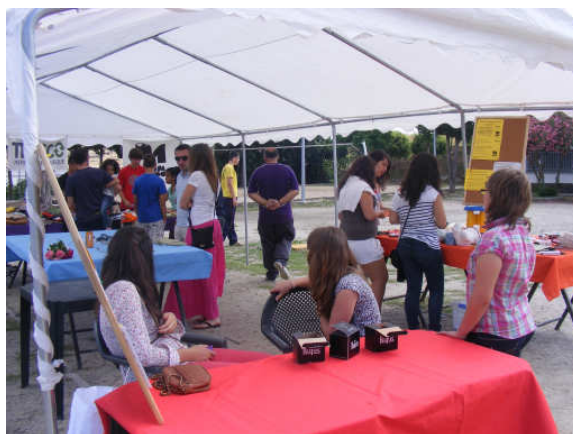
Mercado de Troca em Alcántara, com os jovens do projecto Mudalmando

- identificação de alternativas ao sistema dominante de valores respeitantes ao consumo.