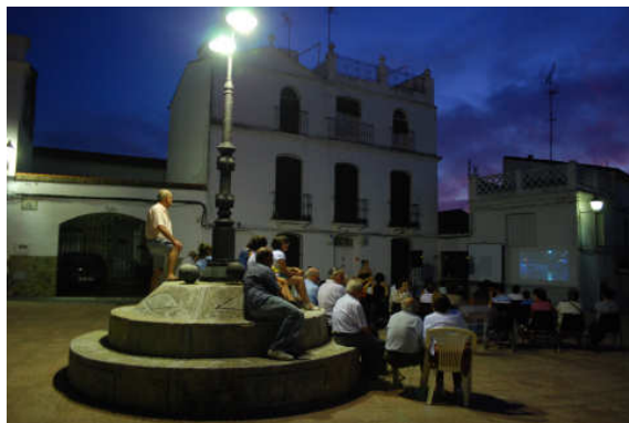
Sessão de cinema no Llano de las Monjas

acabaram por estar muito menos, já que o filme era longo (2h) e foi passado num dia de semana à noite. A pouca quantidade de gente no final e o avançado da hora (passava um pouco da meia-noite) levaram a que não déssemos continuidade à sessão com uma exposição de perspectivas e debate de ideias.