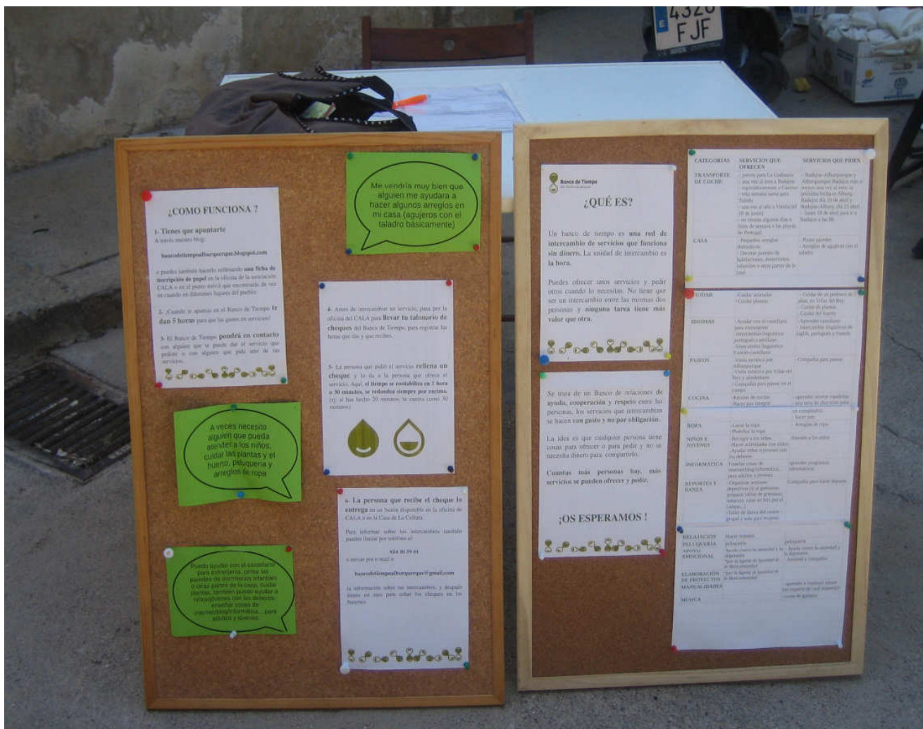
Placard informativo do BdT usado nos pontos de rua

Simultaneamente com a divulgação, procedíamos à gestão administrativa dos recursos humanos: as inscrições de pessoas, os contactos entre usuários para realizar troca de serviços, o registo de contabilidade de cada usuário.