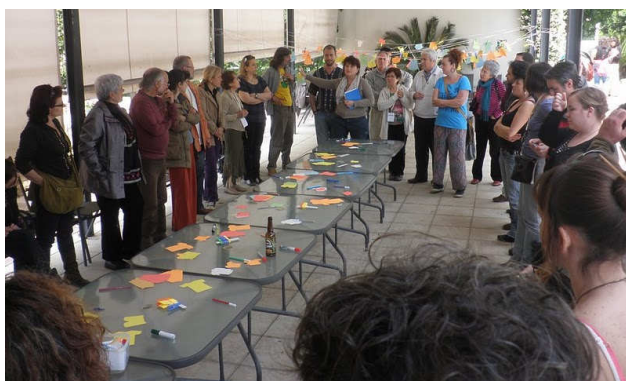
Idearia – 10º Encontro de Economia Alternativa e Solidária (Córdoba, Abril 2011), ao qual tive oportunidade de ir e de assistir a conferências e workshops sobre Economia e Sustentabilidade, Soberania Alimentar, Consumo Responsável, Educação para o Desenvolvimento, Comércio Justo, Cooperação Internacional, Boas práticas de Economias Alternativas e/ou Solidárias.

As principais preocupações deste tipo de economia são: a igualdade; o trabalho nas suas dimensões humana, social, cultural, ambiental, política e económica; a sustentabilidade ambiental; a cooperação; o princípio “sem fins lucrativos”; e o compromisso com o contexto onde se insere.