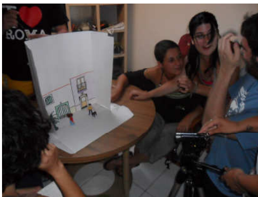
Realização do Teatro de Objectos para o anúncio

Apesar de ninguém envolvido na actividade ter experiência em publicidade ou marketing nem em anúncios de tv, a ideia de experimentar o Teatro de Objectos pareceu a todos/as uma opção interessante e divertida de explorar. Contando com o entusiasmo e com a veia teatral dos jovens de Cala2, identificados aqui como associação Sambrona (o grupo criou uma associação que se dedica ao teatro e afins desígnios artísticos), para o processo de filmagem, ao anúncio foi acrescentada uma música e o logotipo do Banco de Tempo.